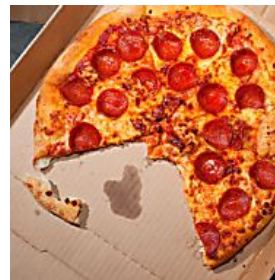
MACH DEN FOOD-TEST! WELCHES ESSEN PASST AM BESTEN ZU DIR?