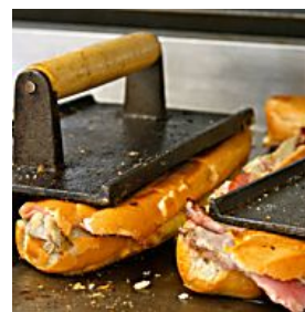
CUBAN SANDWICH DAS SANDWICH, UM DAS MAN SICH IN FLORIDA STREITET