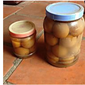
SUPER-GETRÄNK AUS ASIEN DIESES MITTEL AUS VIETNAM HILFT GEGEN SCHWITZEN