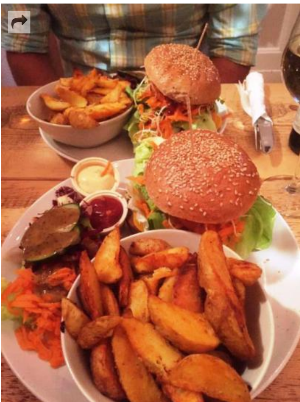
Burger zählen neben Crêpes zu den Spezialitäten im Let It Be

Dass Burger auch ohne Fleisch köstlich sein können, zeigt dieses Lokal in der Treptower Straße in Berlin. Weitere Spezialität des Hauses sind Crêpes; alle Speisen sind nach großen Künstlern und Berühmtheiten benannt. Auch internationale Gäste zeigen sich begeistert, etwa vom „Mike Tyson BBQ (Soja) Steak Burger“. Ein Gast aus England bei Tripadvisor: „Sehr freundlich, sehr leckere hausgemachte Speisen. Ganz einfach die besten Burger und Crêpes. Interessante Auswahl an Getränken. Ein klasse veganes Restaurant in Berlin!“