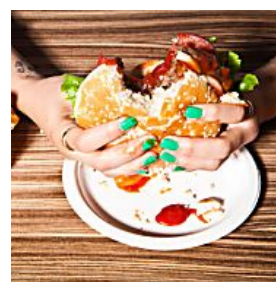
VON BURGER-FANS BEWERTET DAS SIND DIE 20 BESTEN BURGERLÄDEN IN DEUTSCHLAND