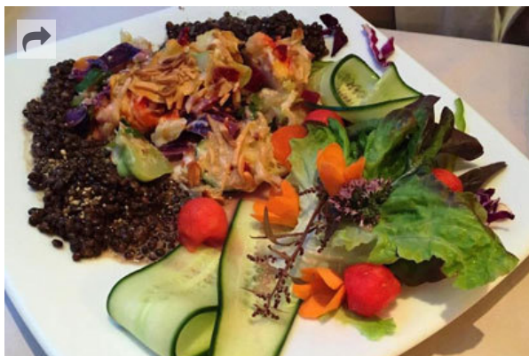
Frisch und lecker: ein Teller im Coburger Naturkost Restaurant Tie

Das nach eigenen Angaben „erste Naturkost-Restaurant“ Coburgs, das es schon seit mehr als 30 Jahren gibt, setzt auf regionale Produkte „für Gourmets“. Die Gäste schätzen besonders die kreative Speisekarte, auf der man Köstlichkeiten wie Kartoffelsuppe mit schwarzen Möhren, Rote-Bete-Scheiterhaufen mit Kastanien überbacken oder fränkische Pfefferrahmlinsen findet. Aus der Bewertung eines Gastes bei Tripadvisor: „Ein Restaurant, das sich völlig vom üblichen Mainstream abhebt. Die klare Ausrichtung auf gesunde Küche und saisonale Produkte wird geschmacklich überzeugend umgesetzt.“