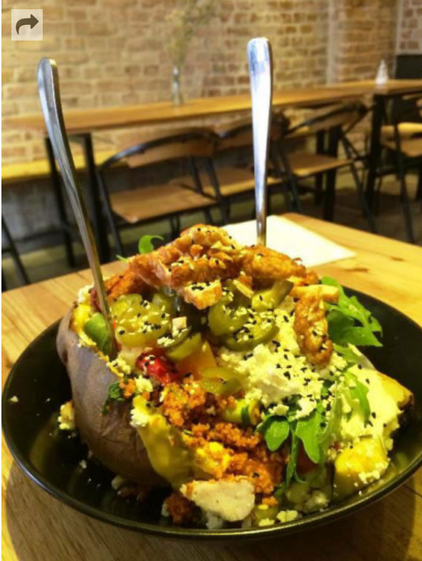
Das Patta in Berlin serviert Kumpir, Ofenkartoffeln mit viel Inhalt