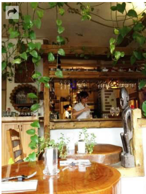
Im Zodiac in Essen sitzt (und isst) man besonders schön