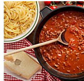
ORIGINAL SPAGHETTI & CO. DAS SIND DIE 10 PASTA-TRICKS DER ITALIENER