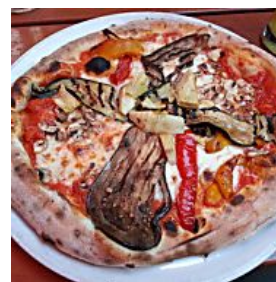
VON IMBISS-BUDE BIS EDELL... IN DIESEN 11 LÄDEN GIBT'S DIE BESTE PIZZA BERLINS