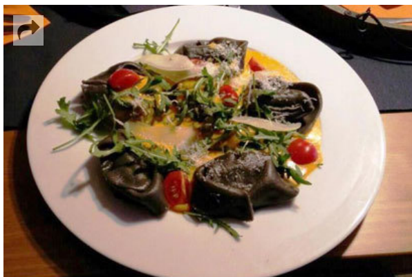
Ein Pasta-Gericht im Restaurant Soup & Soul Kitchen

Das Restaurant mit dem klangvollen Namen Soup & Soul Kitchen ist im Haus einer historischen Dampfbäckerei in Goslar untergebracht. Im Angebot: vegetarische und vegane Suppen, Pasta und Salate sowie Bio-Weine, begleitet von souligen Klängen. Besucher schwärmen von der Kochbananen-Ingwer-Suppe, dem Karottenbrot und den Nudeltaschen mit Ziegenfrischkäse. Auch Allergiker werden hier fündig: „Mein Wunsch – gluten- und laktosefrei – war überhaupt kein Problem. Vielseitige Karte. Wirklich außergewöhnlich gut“, so ein Gast auf Tripadvisor.