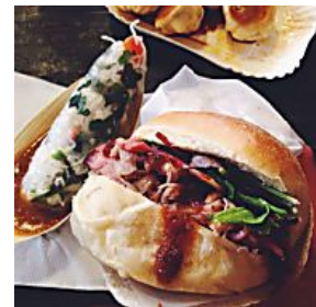
HAUPTSTADT DIE 5 COOLSTEN STREETFOOD- MÄRKTE IN BERLIN