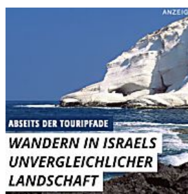
ABSEITS DER TOURIPFADE WANDERN IN ISRAELS UNVERGLEICHLICHER LANDSCHAFT DAS TOTE MEER HIER FÜHLEN SIE SICH WOHL, HIER WERDEN SIE GESUND