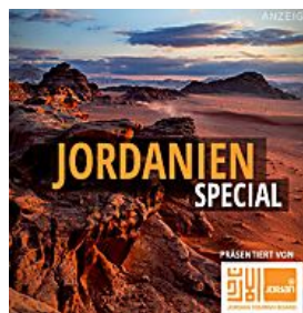
JORDANIEN SPECIAL KLASSE STATT MASSE WEG VON MASSENTOURISMUS ...