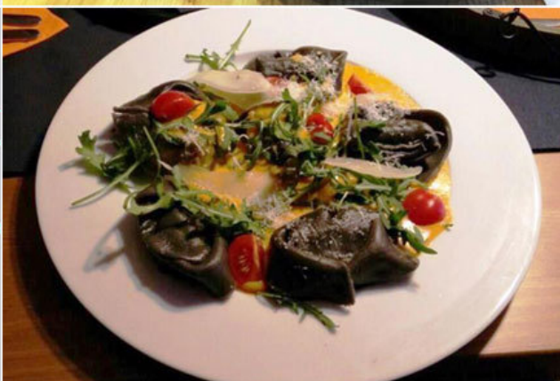
Vegetarisches und veganes Essen ist alles andere als eintönig – wie unter anderem diese vier Gerichte zeigen. Gekocht wurden sie in den laut Tripadvisor zurzeit beliebtesten Veggie-Restaurants Deutschlands.