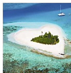
BIS ZU 70 % SPAREN SO GÜNSTIG KANN LUXUS SEIN