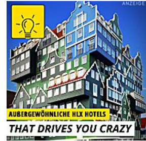
AUSSERGEWÖHNLICHE HLX H... THAT DRIVES YOU CRAZY!