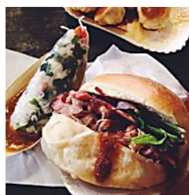
HAUPTSTADT DIE 5 COOLSTEN STREETFOOD- MÄRKTE IN BERLIN